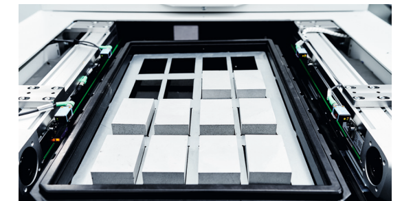
Roboter Be- und Entladeplatz