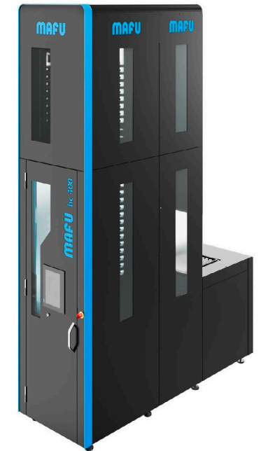
Bedien- und Rüstplatz